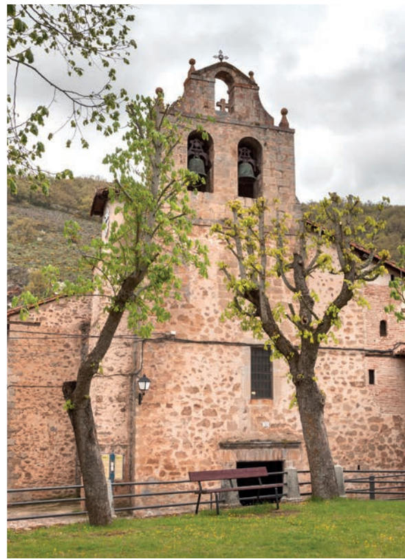
Iglesia de San Martín desde El Prado

La iglesia se encuentra en un espacio ajardinado donde se realizan las actividades públicas y sociales del lugar. Es un edificio de tres naves construido en mampostería y sillería, erigido a finales del siglo XVIII, sobre otro templo anterior. En el retablo se representan escenas de la vida de San Martín, y son abundantes las esculturas barrocas en los altares. La imagen de San Antonio ha sido muy venerada ya que es el patrón del lugar y celebra sus fiestas en el mes de junio.