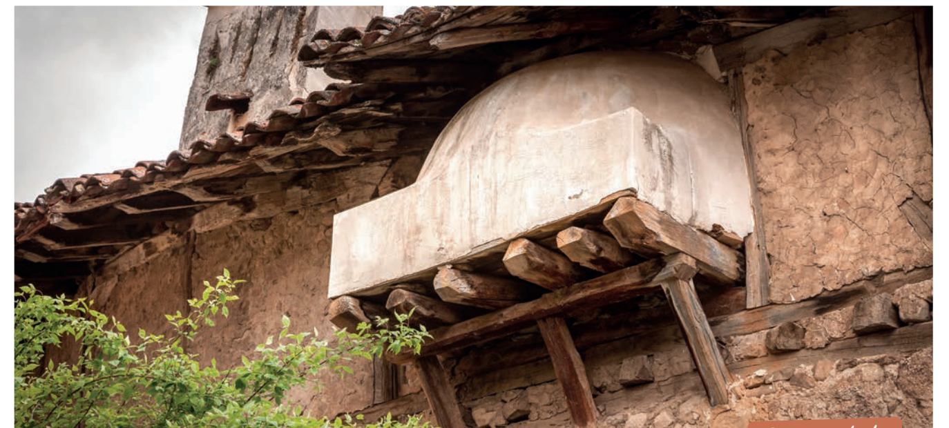
Los Hornos de pan, son uno de los elementos singulares que ofrece la localidad

Estas panzudas construcciones que poseían casi todas las familias serranas permitían realizar el pan de forma semanal para toda la familia y los allegados. Hoy, quedan pocos en uso en la sierra. Con los cereales que se producían en el lugar y se molían en el cercano molino, se hacían las harinas con las que