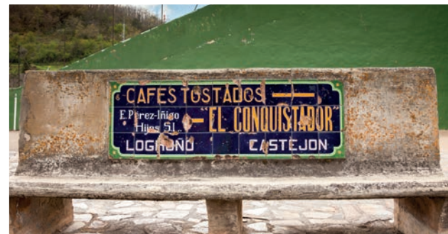
Uno de los bancos de hormigón de El Prado, con anuncios del siglo pasado

Este espacio de descanso y ocio, se encuentra formando un conjunto con la Iglesia, la carretera y el frontón. Es el lugar de reposo y sus árboles, castaños y tilos, dan frescura en época estival.