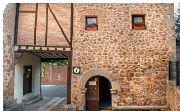
Hórreo. Oficina de Turismo de Cameros

Un edificio adosado al templo, servía para recolectar los diezmos que los habitantes del lugar pagaban a su parroquia. Esos espacios llamados hórreos o cillas eran habituales en cada pueblo. A partir de su restauración, el hórreo de Pradillo se ha convertido en un espacio dinámico desde el punto de vista turístico y cultural. En él, se alberga la Oficina de Turismo