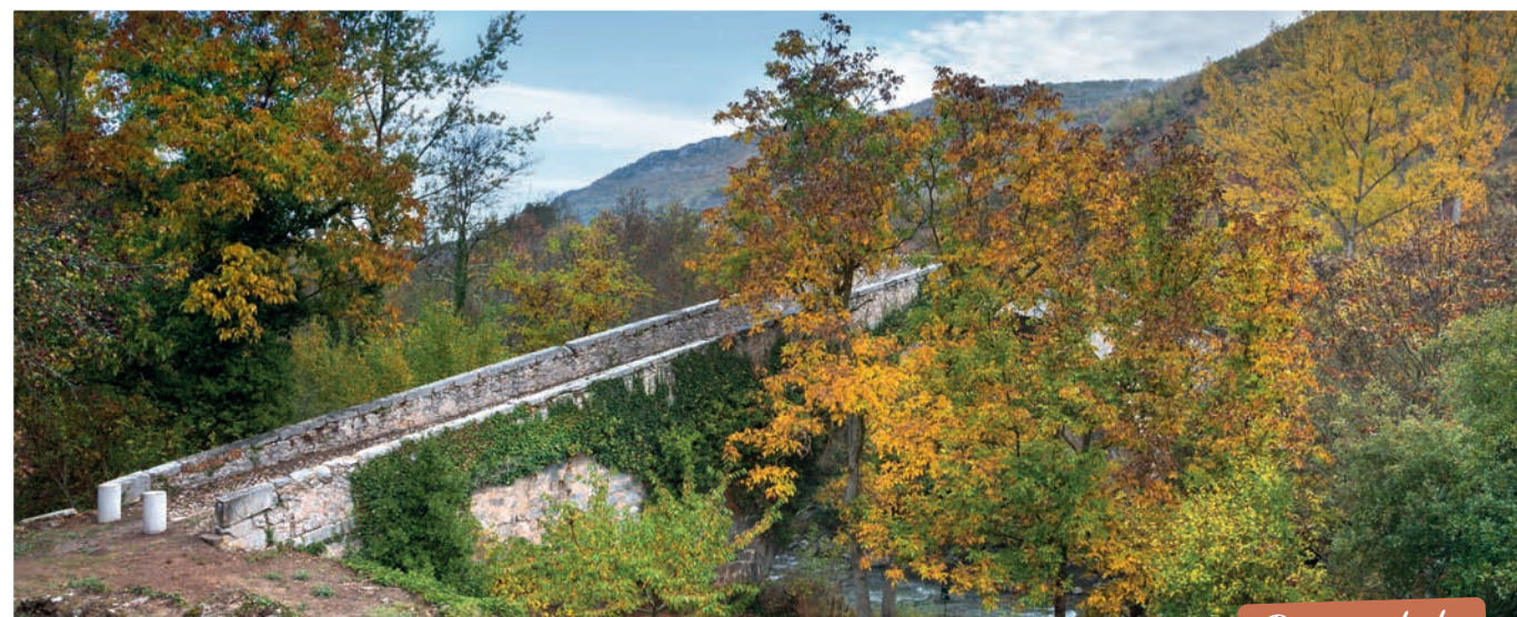
Arranque del puente medieval del Iregua, de gran importancia en épocas pasadas